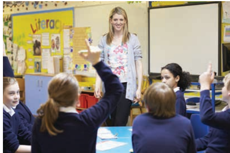
Slika 2 : Tradicionalne metode pouka v razredu se bodo v prihodnosti spreminjale in kombinirale s poukom na daljavo [3, 7, 12].

Vsekakor svoboda zahteva tudi samodisciplino učenca. Učenec mora znati obvladovati čas in ustrezno načrtovati svoj urnik. To velja predvsem za tiste naloge in zadolžitve, ki mu jih naloži učitelj v sistemih, ki ne zahtevajo učenčeve prisotnosti ob točno določenem času in na točno določenem video predavanju. Enako velja za učitelja. Poučevanje na daljavo od učitelja zahteva visoko stopnjo organiziranosti, napora in delo v t. i. nepredvidenih razmerah. Slednje pomeni, da mora biti učitelj zaradi morebitnih dodatnih pojasnil učencem na razpolago ves čas, tudi izven rednega delovnega časa [2].