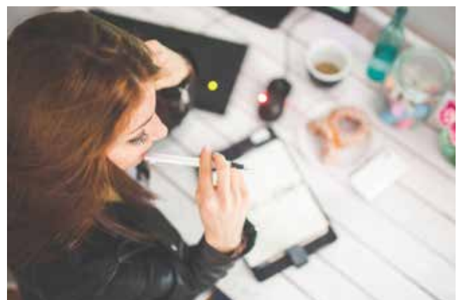
Slika 3 : Pouk na daljavo omogoča učinkovito izrabo časa [2, 12].

Preprostost uporabe izbranega orodja je vedno ključ do uspeha. Vsak sistem, ki ga sprejmemo za