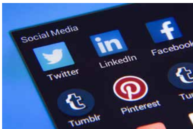
Slika 5 : Učence je potrebno osveščati o varni, etični in odgovorni uporabi interneta in mobilnih naprav [2, 13].

Pouk na daljavo prinese tudi spletne nevarnosti. Učenci izvajajo dodatne spletne aktivnosti, ki se jih pri tradicionalnem načinu pouka niso lotevali. Omrežno okolje je namreč mesto, kjer se lahko pojavijo številna varnostna tveganja: zlonamerni napadi, vdor hekerjev, prestrezanje informacij, onemogočanje storitev, spreminjanje podatkov in podobno. Omrežna varnost je ena izmed pomembnih varnostnih vprašanj e-učenja [8]. Zato je treba učence pri pouku na daljavo opozarjati na varno rabo interneta in ustrezno uporabo programske opreme.