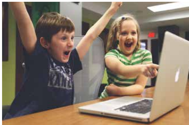
Slika 1 : Pouk na daljavo

Internet kot najpomembnejši oblikovalec pouka na daljavo zabriše mejo med tem, kar je blizu, in tem, kar je daleč. Zaradi tega pouk na daljavo podira sedanjo paradigmo izobraževanja [2]. Medtem ko bodo učitelji še naprej sestavni del življenja vsakega učenca, bo sodobna tehnologija premostila fizični prostor med učitelji in učenci. Učenje na daljavo je že kar nekaj let sestavni del programov številnih izobraževalnih ustanov, ki izkoriščajo prednosti tovrstnega prenosa znanja. V času covid-19 ta način učenja predstavlja rešitev za vse izobraževalne institucije, od osnovnih in srednjih šol pa vse do fakultet [4, 2]. V nadaljevanju si pogledjmo najpogostejše oblike učenja na daljavo: