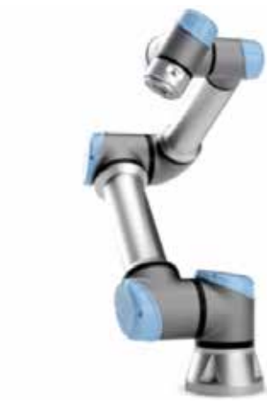
Slika 4 : Sodelujoči robot URx [6]

pridejo z njim v neposredni kontakt. Uporabljeni so lahki materiali, robovi so zaokroženi, so oblaženi z vgrajenimi senzorji v robotovi osnovi ali v členkih, ki merijo silo, momente in hitrost gibanja, kar mora vse zagotoviti, da ne delujejo izven določenega praga oziroma področja, ko nastane kontakt med človekom in SR.