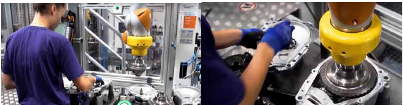
Slika 3 : Drug poleg drugega delavka v montaži in KUKA cobot v tovarni BMW.

Sočasno je podjetje Universal Robots v letu 2008 prodalo svoj prvi SR UR5. Štiri leta kasneje je podjetje Universal Robots poslalo na trg robote UR10, UR3 in UR15. Podjetje danes velja za največjega dobavitelja sodelujočih robotov v svetu in je prodalo