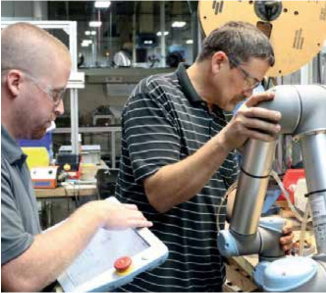
Slika 6 : Programiranje SR. Vir: [18].

opravlja vedno iste gibe in opravila. Lahki in enostavno programirani SR se lahko premikajo med montažnimi mesti – ali pa so nameščeni na mobilnih vozičkih, če je to priročno. Pri tem je treba vsakokrat, ko se SR premakne, lokalizirati njegov položaj glede na njegov delovni prostor, tako da bodo sestavni deli in stroji tam, kjer jih robot pričakuje. Krmilni program je lahko shranjen na konzoli in se lahko ponovno naloži s pritiskom na gumb.