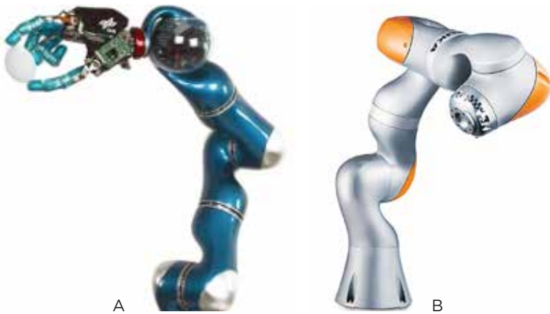
Slika 2 : Sodelujoči robot (A), razvit v DLR, in (B) KUKA cobot LBR iiwa