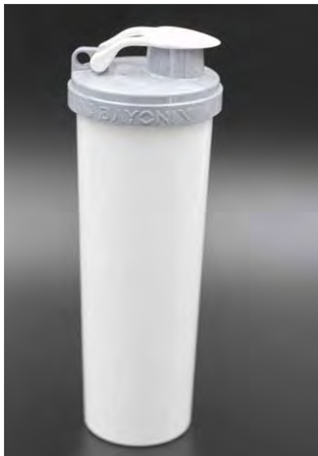
Slika 3 : Certificiran proizvod športne steklenice BAYONIX [6]

Inovativna steklenica BAYONIX predstavlja prvo športno steklenico, ki je prejela certifikat Cradle to Cradle Certified na »zlatem« nivoju. Je zelo lahka, v njej je tekočina v celoti (100 %) obdana z ma-