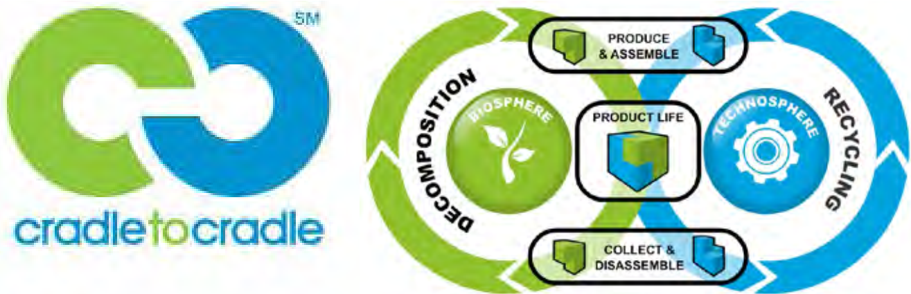
Slika 1: Logotip Cradle to Cradle s snovnim tokom materiala v dveh ciklih: biološki (biosfera) in tehnološki (tehnosfera) cikel [4]