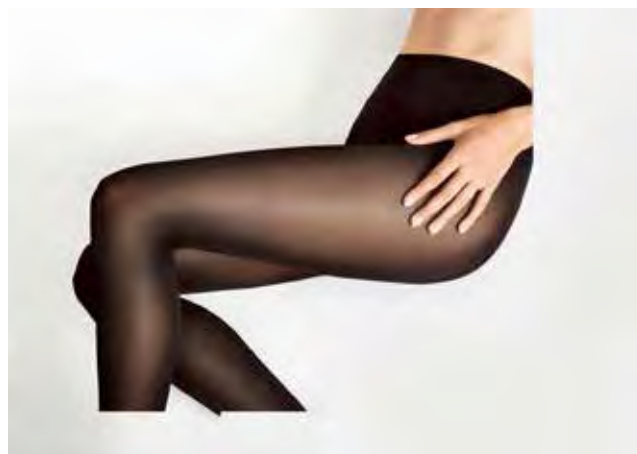
Slika 5 : Certificirana linija premium textila Wolford [9]

Avstrijsko tekstilno podjetje Wolford [8] z lokacijama Bregenz v Avstriji in Murska Sobota v Sloveniji odpira novo zgodbo v smeri krožnega gospodarstva. To je preboj na področju oblačil in tekstila.