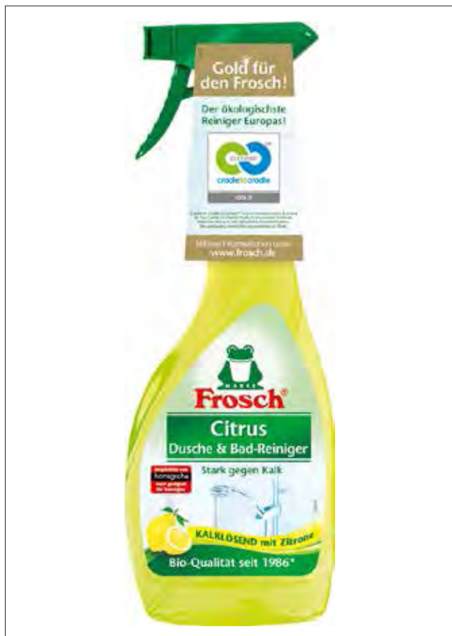
Slika 4 : Certificiran produkt WERNER & MERTZ Frosch GOLD [7]

v procesu načrtovanja je razvoj celovite konotacije kakovosti s pozitivno opredelitvijo sestavin. Izdelki morajo biti v prihodnosti zasnovani tako, da so uporabni za materialne cikle. Potrebno je izboljšati kakovost recikliranih postopkov tako, da je možno recikliranje na enaki ali celo višji ravni.