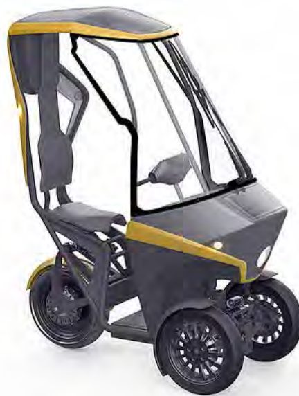
Slika 6 : BICAR [10]

BICAR je poimenovan »zlato oko« kot nov način oblikovanja in doživljanja vožnje na kratkih razdaljah.