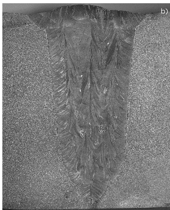
Slika 3 : Varjenje vzorca med izvedbo WPQR (a) in makro obrus zvara (b)