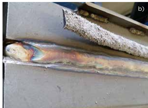
Slika 2 : Preliminarni testi z navarjanjem (levo) in v zv. žlebu na 30-milimetrski pločevini (desno)