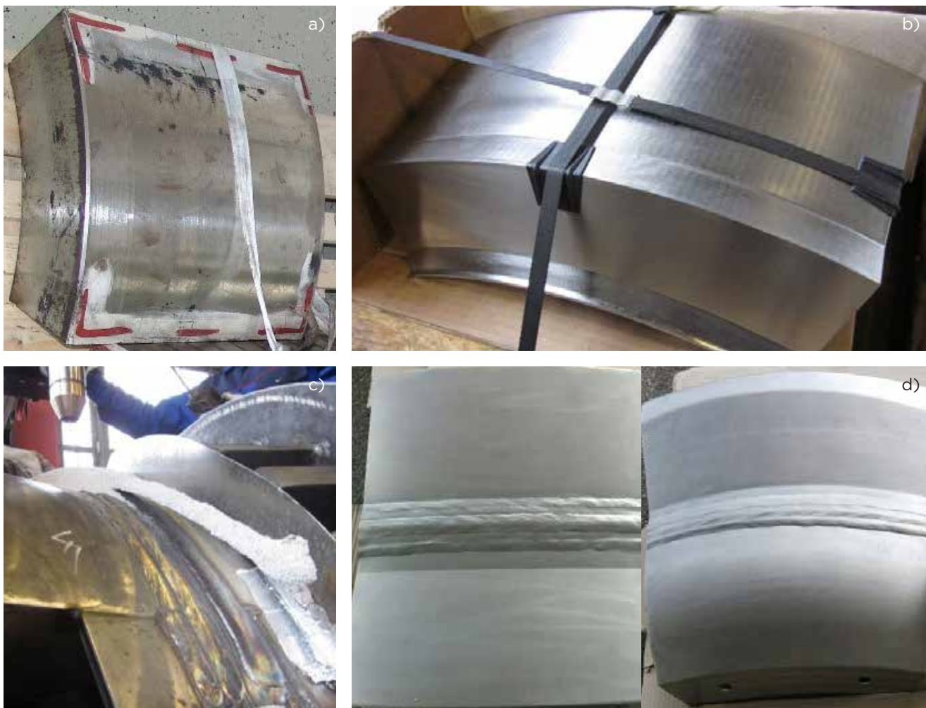
Slika 4 : a) Odkovek, b) odkovek s pripravljnim zvarnim robom, c) EPP-varjenje odkovkov in d) končni videz izdelanih zvarov

nitev zvarnih žlebov je bilo potrebnih 47 (debelina 70 mm) oz. 71 varkov (90 mm) pri parametrih: I = 354-433 A; U = 29-33 V; v = 33,3-51,5 mm/min. Končni videz varjencev obeh oblik je prikazan na sliki 4 d.